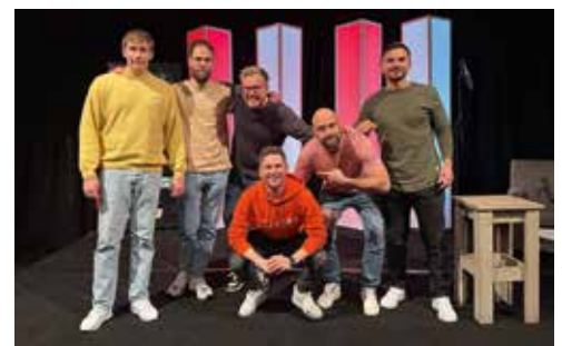
Comedy in the Box, ebenfalls in der Red Box Mönchengladbach