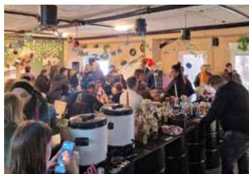
Die Bar erfreut sich auch in den Wintermonaten großer Beliebtheit, nicht zuletzt wegen des gut gefüllten Veranstaltungskalenders.

Im März geht auch ein weiteres neues Projekt der beiden Inhabenden weiter, nämlich der Live-Podcast „ Nonsense und Action “, bei dem immer spannende „Local Heroes“ zu Gast sein werden. Nach Bro und Uschi von RideReview wird es am 29.03. die MonroeRanch sein. Zuhörer und Gäste sind natürlich auch hier herzlich willkommen.