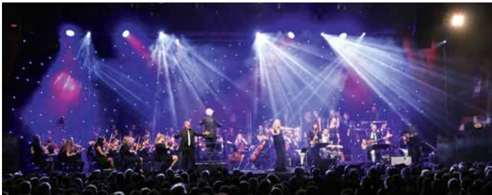
Pop meets Classic - die Night in white Satin kommt am 15. und 16. März wieder ins Kunstwerk