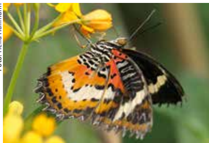
Leopardennetzflügler (Cethosia cyane)

Ein farbenfrohes Jubiläum feiert der Zoo Krefeld in diesem Jahr. Der SchmetterlingsDschungel wird 15 Jahre alt.