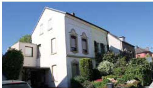
Ein „Glabbacher Haus“ in einem Wohngebiet Nähe Volksgarten

MÖNCHENGLADBACH UND SEINE NEUBAUPLANUNGEN