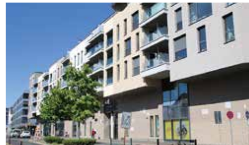
Die Neubebauung an der Steinmetzstraße