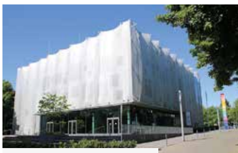
Die Textil-Akademie NRW an der Rheydter Straße

Von neuer schöner Architektur in Mönchengladbach ist kaum die Rede. Was soll das auch sein? Über Schönheit, gerade auch in der Architektur, lässt sich streiten. Weniger gehen die Meinungen aber darüber auseinander, was eine interessante oder gar sehenswerte Architektur ist. Das Blauhaus der NEW und die Textilakademie fallen da ein, aber sind diese Gebäude im land-