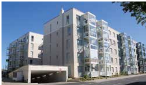
Die ersten Blöcke der Seestadt an der Lürriper Straße