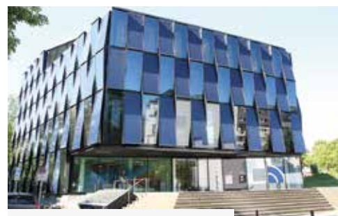
Das NEW-Blauhaus an der Richard-Wagner-Straße

läufigen Sinne schön? Von einer Art Landmarke oder überregionalen Anerkennung reden wir da besser nicht. Ebenso verhält es sich bei den Roermonder Höfen, obwohl diese einen Architektur- und Designpreis erhielten. Niemandem scheint aufgefallen zu sein, dass diese Baugruppe städtebaulich ein Fremdkörper in der gesamten Nachbarbebauung darstellt. Die Bebauung macht den Eindruck eines architektonisch isolierten Crescendo, kontextlos, ohne Umweltbezug und Urbanität. Bewohnende mögen dies anders sehen. Nun ja: Investorenarchitektur muss die größtmögliche Rendite aus einem Grundstück herausholen (z.B. wurde hier die angekündigte Offenlegung des Gladbachs wegen Kostenersparnis gestrichen). Dabei gerät eine humane Gestaltung zur Nebensache bzw. Beliebigkeit.